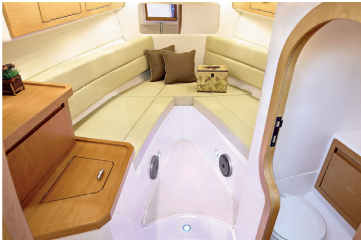
Cabine mais alta e mobiliário moderno